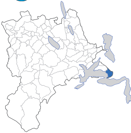
Vitznau an der Riviera des Kantons Luzern